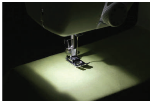
LED 照明燈使縫紉過程更清晰